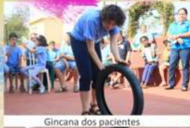
Gincana dos pacientes