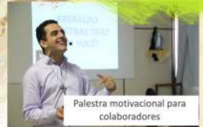
Palestra motivacional para colaboradores