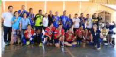
Futsal entre pacientes da Vila e alunos da Escola São Vicente