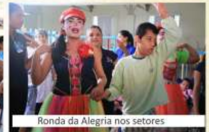
Ronda da Alegria nos setores