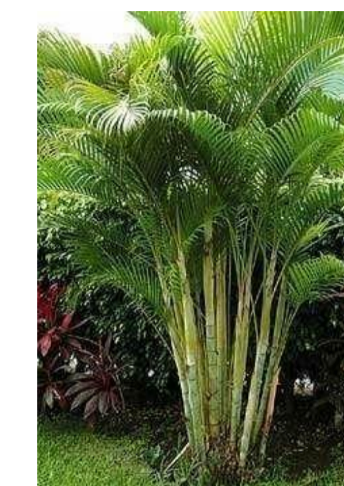
Palmeira de jardim