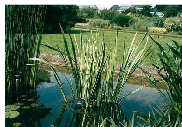
Acorus calamus variegatus