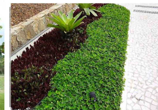
Lamabri roxo, grama Amendoim e Bromelia